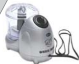
Miniprocessador Black&Decker modelo HC32 - 2 velocidades + pulsar, trava de segurança, jarra com capacidade de 310 ml e lâmina de aço inoxidável.

Triture, no Miniprocessador Black&Decker , os biscoitos, até formar uma farinha grossa. Coloque em uma vasi- lha e junte a manteiga. Misture bem até obter uma massa. Forre o fundo e as laterais de forminhas próprias para tortinhas e de fundo removível. Leve para assar em forno preaquecido a 180° C, por cerca de 10 minutos. Desenforme, deixe esfriar e utilize.