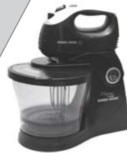
Batedeira MT400 Black&Decker - 5 velocidades + turbo, batedores para massas leves e pesadas, tampa com abertura para adição de ingredientes, tigela e espátula extra.