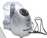
Miniprocessador Black&Decker modelo HC32

+ 2 velocidades, função pulsar/limpar, lâmina de aço inoxidável e tampa dosadora.