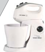
Batedeira MT300 Black&Decker

Despeje a calda sobre o bolo ainda cru e leve-o para assar em forno preaquecido a 180° C, por cerca de 30 minutos.