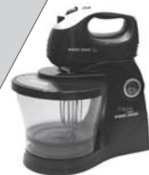
Batedeira MT400 Black&Decker - 5 velocidades + turbo, batedores para massas leves e pesadas, tampa com abertura para adição de ingredientes, tigela e espátula extra.

Em uma panela, ferva o açúcar mascavo com a água até que a calda fique encorpada. Reserve. Na Batedeira Black&Decker bata as claras em neve. Reserve. Na outra tigela da batedeira, misture bem a farinha de trigo, as especiarias, o chocolate em pó e o fermento. Junte a calda, as gemas, o leite e o mel. Bata bem a cada adição. Retire a tigela da batedeira e agregue delicadamente as claras em neve. Despeje a massa em uma assadeira grande, previamente untada e enfarinhada. Leve para assar em forno médio, preaquecido a 180° C, por cerca de 30 minutos. Desenforme depois de frio e corte em círculos. Use o cortador com 5 cm de diâmetro. Recheie os pães de mel com o doce de leite. Derreta a cobertura ao leite (banho-maria ou micro-ondas) e banhe os doces. Decore com a cobertura branca derretida.