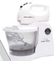
Batedeira BAT 300 Black&Decker - 5 velocidades + turbo, jogo de batedores para massas leves e espátula.