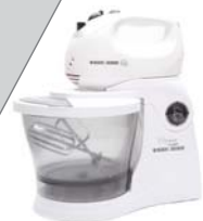
Batedeira BAT 300 Black&Decker - 5 velocidades + turbo, jogo de batedores para massas leves e espátula.

Na Batedeira Black&Decker , bata as claras em neve firme, com 1 pitada de sal. Retire e reserve. Na tigela da Batedeira Black&Decker , coloque a manteiga, o açúcar e as gemas. Bata até obter um creme fofo e esbranquiado. Adicione os demais ingredientes, exceto as claras reservadas, as uvas-passas e o fermento em pó. Alterne as adições sempre com o leite. Bata bem. Desligue a batedeira e junte delicadamente as claras, as passas e o fermento. Misture delicadamente, com movimentos de baixo para cima. Despeje a massa em uma forma média, com furo no meio, untada com margarina e polvilhada com farinha de trigo. Leve para assar em forno moderado, previamente aquecido a 180° C, durante 35 minutos. Desenforme sobre o prato de servir e deixe amornar. Polvilhe açúcar impalpável e decore com uvas-passas.