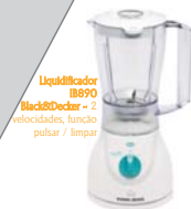
Liquidificador Black&Decker IB890 - 2 velocidades, função pulsar / limpar

*Você pode substituir o presunto por peito de peru defumado.