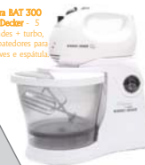
Batedeira BAT 300 Black&Decker - 5 velocidades + turbo, jogo de batedores para massas leves e espátula.