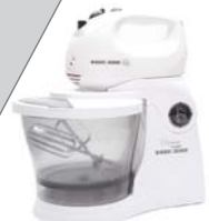
Batedeira BAT 300 Black&Decker - 5 velocidades + turbo, jogo de batedores para massas leves e espátula.

Se desejar, decore também as laterais da forma com 1/2 rodela de abacaxi e ameixas.