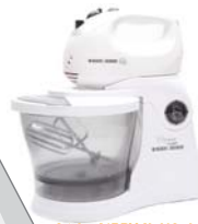
Batedeira BAT 300 Black&Decker - 5 velocidades + turbo, jogo de batedores para massas leves e espátula.