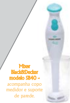
Mixer Black&Decker modelo SB40 - acompanha copo medidor e suporte de parede.

•Você pode substituir o refrigerante sabor guaraná por sabor laranja, limão ou uva.