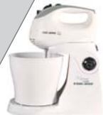
Batedeira MT300 Black&Decker - 5 velocidades + turbo, 1 jogo de batedores para massas leves e pesadas, tigela extra (2 l) e 1 espátula.

Corte o bolo ao meio e umedeça as partes com o leite. Divida o creme ao meio e, a uma delas, junte o chocolate em pó. Misture bem. Sobre o prato de servir, coloque uma camada de bolo e o recheio escuro. Repita, finalizando com o creme claro. Na parte superior, salpique o coco. Já nas laterais, decore com as raspas misturadas.